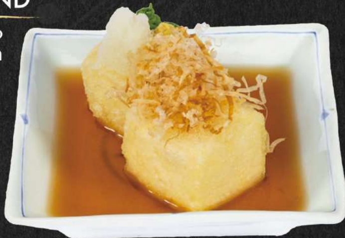
揚げ出し豆腐 50.000 VND

Stir Fried Water Spinach Rau muống xào tỏi 공심채 볶음