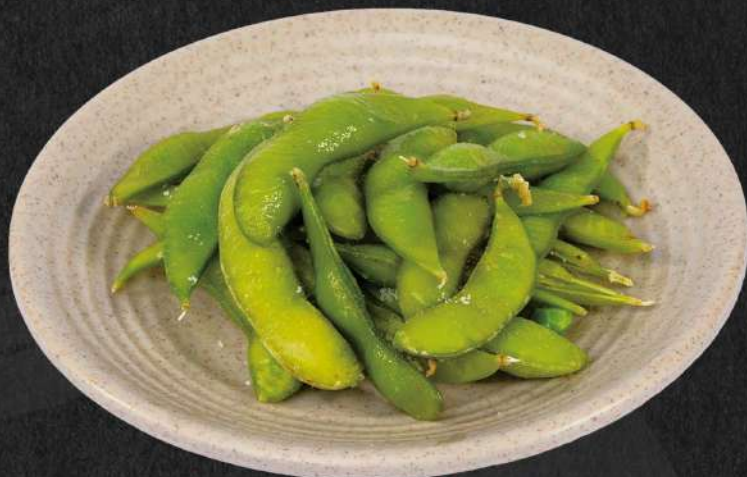
枝豆 30.000 VND