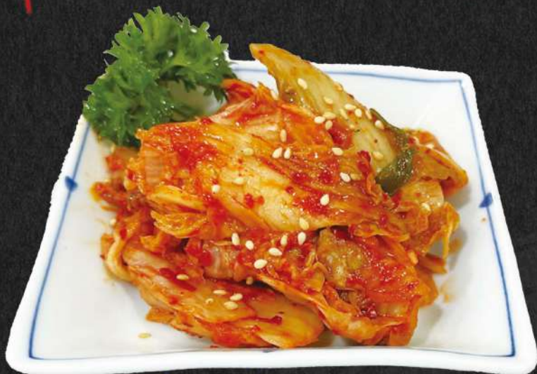
キムチ 30.000 VND