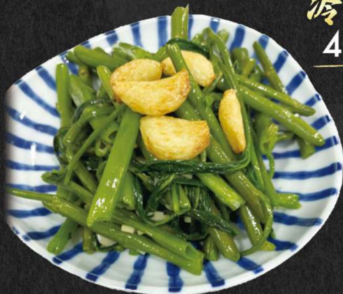
空芯菜炒め 50.000 VND

Stir Fried Water Spinach Rau muống xào tỏi 공심채 볶음