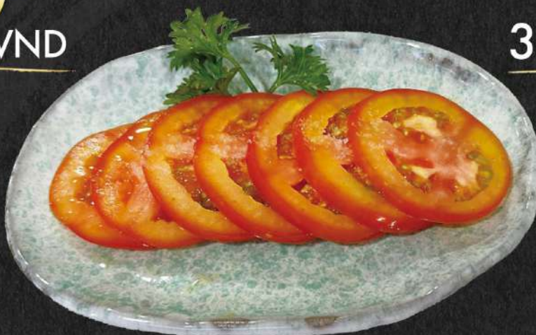
冷やしトマト 40.000 VND